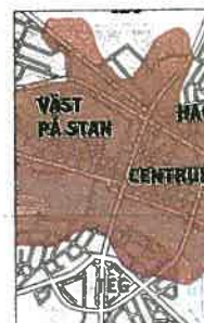
SIDORNA 10-11