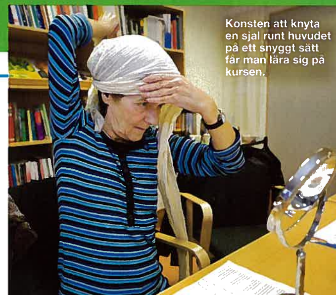
Konsten att knyta en sjal runt huvudet på ett snyggt sätt får man lära sig på kursen.

För att lätta på den hårt knutna sjalen, ta tag i tyget